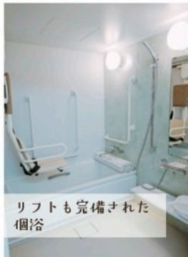
リフトも完備された 個浴