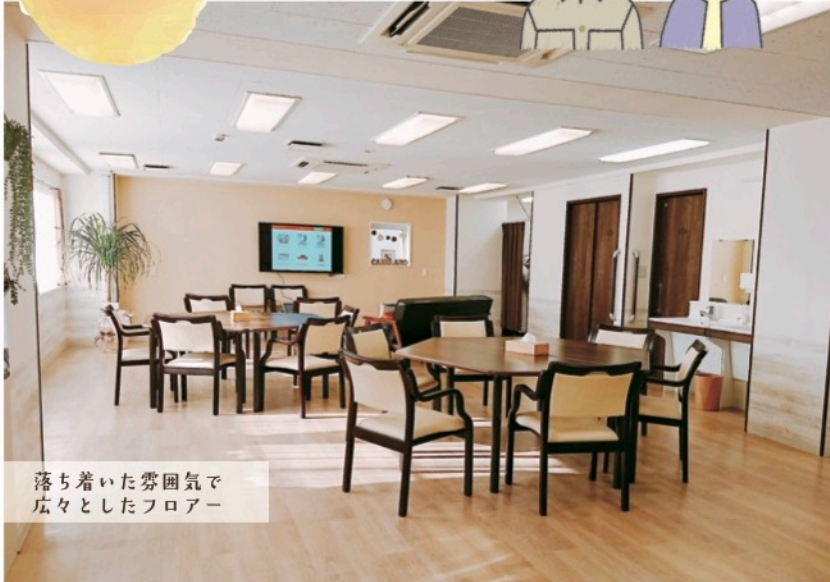
落ち着いた雰囲気 広々としたフロア