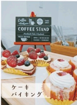
ケーキ バイキング