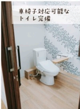
車椅子対応可能な トイレ完備